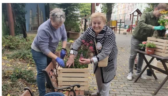
Sadzenie kwiatów dla DPS przy ul. Konarskiego – 23.09.2021 r.