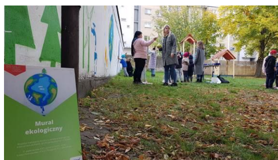
Malowanie muralu ekologicznego – 11.10.2021 r.

W ramach CIL WIL.DA.SIĘ w najbliższym czasie będziemy zapraszać na kolejne spotkania. Może na wzór ul. Główniej uda nam się stworzyć prawdziwą sąsiedzka bibliotekę?