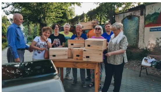
Warsztat manualny - Budowa domków dla jerzyków – 12.08.2021 r. „Topolowy Fyrtel”

Realizujemy obecnie dwa projekty Centrum Inicjatyw Lokalnych WIL.DA.SIĘ (CIL WIL.DA.SIĘ) oraz Wildecki Klub Senioralny „Schron Trzeciego Wieku” (WKS STW) , które są finansowane z budżetu Miasta Poznania. Projekty te realizowane są przez Stowarzyszenie Schron Kultury Europa. Większość działań w ramach WKS STW została zrealizowana w okresie wiosenno-letnim. Cały cykl wydarzeń (koncertów, zajęć manualnych, spacerów po Poznaniu, wyjść kulturalnych, treningów pamięci, qigong) dedykowany osobom starszym staraliśmy się tak prowadzić, aby na wypadek kolejnego lockdown'u lub ograniczenia działalności klubów seniora móc we właściwy sposób rozliczyć się z rezultatów i środków finansowych z Urzędem Miasta Poznania. W związku z powyższym, obecnie podejmujemy próby pozyskania dodatkowych środków w formie mikro grantów na kontynuację wybranych zajęć takich jak: qigong, treningi pamięci, a także wprowadzenie nowych form spotkań jak: grupowe zajęcia na pływalni czy nordic walking.