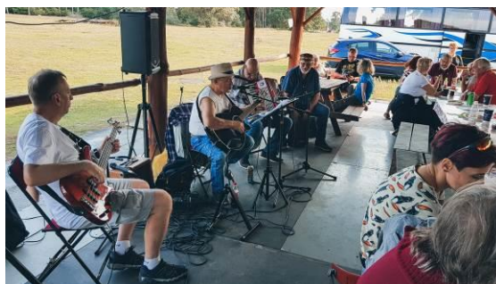
Gra Zespół KLIKA –śpiewają wszyscy biwakowicze

11 września, mieszkańcy ul. Rolnej mieli okazję pożegnać lato. Pod dużą zadaszoną wiatą, chroniącą nas przed deszczem, ale też i słońcem, wycieczkowicze mieli okazję posłuchać i pośpiewać z naszym schronowym o zespołem KLIKA. Oprócz tego, rozpaliliśmy ognisko, piekliśmy kiełbaski, a także mieliśmy okazję skosztować swojskiej grochówki z pajdą chleba, smalcem i kiszonym ogórkiem. A w międzyczasie trwały zawody jeździeckie, na których można było podziwiać wyczyny zawodników skaczących przez przeszkody. A część osób spacerując po okolicznych terenach zabrały ze sobą sowy (grzyby, a nie ptaki), a Ci którzy zapędzili się do stajni mogli nawet nakarmić marchewkami i jabłkami konie. Cały autokar wracał w dobrych humorach, których nawet przelotne burze nam nie zepsuły. Całe wydarzenie było możliwe do zrealizowania dzięki środkom finansowym z Spółdzielni Mieszkaniowej Lokatorsko-Własnościowej „Rolna”, a także dzięki wsparciu finansowemu z budżetu Miasta Poznania w ramach realizacji projektu Centrum Inicjatyw Lokalnych „WIL.DA.SIE”.