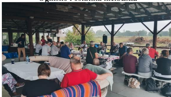
Wspólna konsumpcja i sąsiedzkie rozmowy na biwaku. (Więcej zdjęć stronie SKE na Facebooku).