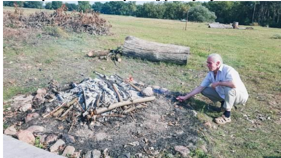
Ognisko i ostatnia kiełbaska