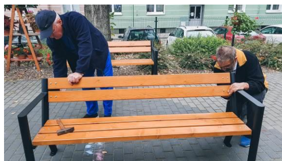
Montaż ławczek na Topolowy Fyrtek – 17.09.2021 r.

października współtworzyliśmy festyn organizowany przy Szkole Podstawowej nr 5 w Poznaniu. Dzięki naszym lokalnym partnerom zaoferowaliśmy uczniom, rodzicom i gronu pedagogicznemu powrót do przeszłości. Czekaliśmy na nich smaki dzieciństwa (m.in. wspólne szykowanie pyry z gzikami), powrót do starych zabaw podwórkowych (m.in. Baba Jaga patrzy czy wyścig pokoju z kapslami) czy eksperymenty obrazujące wpływ źródeł energii na klimat w przeszłości i obecnie. Jednocześnie przy terenie Szkoły wspieramy przedszkolaków, gdzie na ich placu zabaw powstaje mural o tematyce ekologicznej.