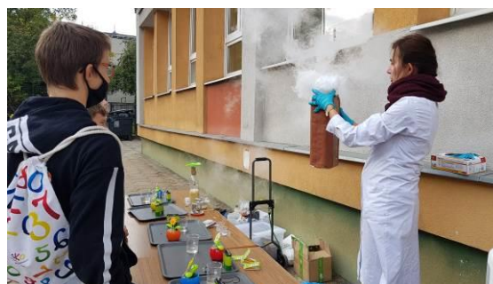
Festyn przy SP 5 – 11.10.2021 r.

Szczegóły na temat zajęć i wydarzeń realizowanych przy Schronie Kultury Europa można znaleźć na stronie internetowej www.facebook.pl/SKEuropa oraz na drzwiach wejściowych do SKE przy ul. Rolnej 24. Na facebooku zamieszczamy także relacje z odbytych wydarzeń wzbogacone o fotorelacje wykonane przez uczestników lub organizatorów.