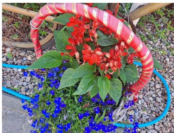
Kwiaty na „Topolowym Fyrtlu” ..