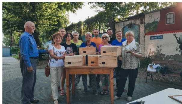
Budki łęgowe zrobione własnoręcznie przez seniorów

Zapraszamy do oglądania i rozsądnego korzystania z przygotowanych propozycji programowych.