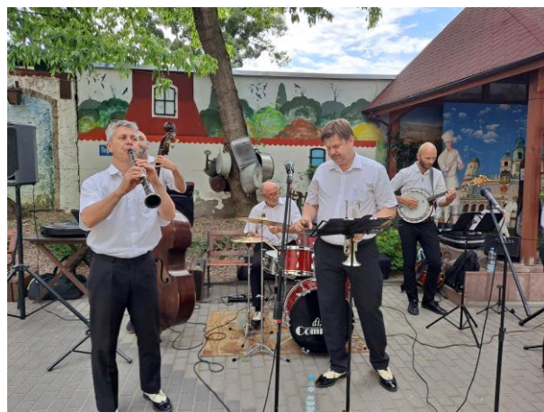
Koncert zespołu Dixie Company