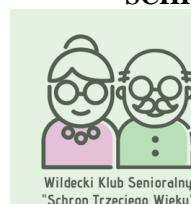
Wildecki Klub Senioralny "Schron Trzeciego Wieku"