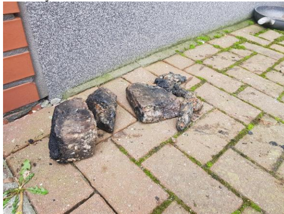
Niektóre skarby znalezione w rurze kanalizacyjnej

Na początku 2019 roku doszło do kilkakrotnego zapychania się pionu kanalizacyjnego przy ul. Rolnej 44 w Poznaniu. Częste awarie (powtarzające się co dwa dni), skłoniły nas do podjęcia działań mających na celu rozpoznanie głównej przyczyny tej awarii. W dniu 8 stycznia br. wezwaliśmy specjalistyczną firmę zajmującą się inspekcją pionów kanalizacyjnych za pomocą kamery. Jakież było zdziwienie pracowników Spółdzielni, ale także firmy dokonującej inspekcji, kiedy w pionie odkryliśmy... ogromne kamienie. Nie mamy pojęcia jak one tam się znalazły. Mogło to nastąpić już wiele lat temu podczas inwestycji wymiany pionów kanalizacyjnych, ale także podczas gruntownego remontu jednego z mieszkań przy ulicy Rolnej 44. Uczulamy, że zlew, umywalka czy toaleta to nie śmietnik. Wrzucanie do nich pieluch, nawilżanych chusteczek higienicznych, podpasek, narzędzi budowlanych, resztek gruzu (wszystkie wymienione artykuły mieliśmy okazję znaleźć na przestrzeni ostatnich lat w pionach kanalizacyjnych) może skutkować poważnymi awariami, a w konsekwencji doprowadzić do zalań należących do Państwa lokali mieszkalnych.