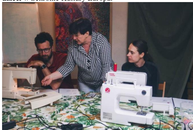
Kurs szycia na maszynie – 06.05.2024 r. – SK „Europa”