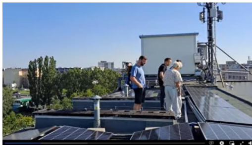
Komisja odbiorowa na dachu budynku przy ul. Rolnej 16-28

technicznej budowę naszej sieci fotowoltaicznej.