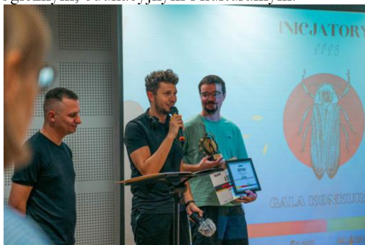
Gala konkursu Inicjatory – 08.09.2024 r.

przestrzeni sąsiedzkiej na działania o charakterze ekologicznym, edukacyjnym i kulturalnym.