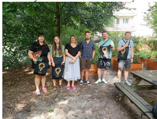
Wizyta studyjna w Krakowie – 25.08.2024 r.

Dzięki dotacji od Centrum PISOP udało się członkom Stowarzyszenia wyjechać do Krakowa na wizytę studyjną , aby zobaczyć jak tam działają podobne organizacje i jak one prowadzą ogrody społeczne. Ale dzięki tej dotacji mogliśmy też doposażyć się w bezprzewodowy sprzęt nagłośnieniowy, który będzie służył Schronowi Kultury Europa przy organizacji wydarzeń na świeżym powietrzu. Gościliśmy także u nas studentów Uniwersytetu Adama Mickiewicza, którzy na naszym przykładzie uczyli się jak może być realizowana społeczna misja nieruchomości mieszkaniowych