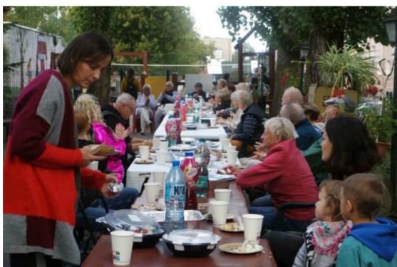
Wspólna biesiada na „pożegnanie lata”, na Topolowym Fyrtilu

Dziękujemy, jak co roku, wszystkim uczestnikom i uczestniczkom biorącym udział w działaniach Schronu Kultury Europa. Dziękujemy wolontariuszom i wolontariuszkom, mieszkańcom i mieszkankom, którzy pomagają współtworzyć ofertę zajęć i wydarzeń w Schronie Kultury Europa. Na koniec dziękujemy zespołowi Stowarzyszenia Schron Kultury Europa, który pomaga zarządzać i ożywiać to miejsce, aby służyło