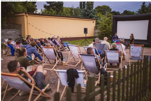
Spotkanie autorskie o podcaście Kino Tęcza – 25.05.2024 r. – ROD im. M. Jackowskiego