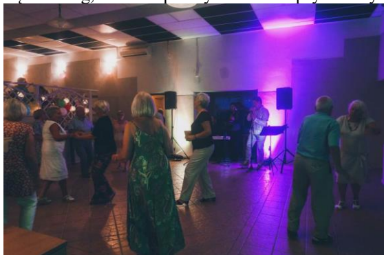
Dancing Senior – 06.09.2024 r. – Restauracja na ul. Wspólnej

Cieszy nas fakt, że mogliśmy kontynuować prowadzenie Wildeckiego Klubu Senioralnego „Schron Trzeciego Wieku” , którego uczestnikami i uczestniczkami są osoby w wieku 60+ zamieszkujące w Poznaniu. W ramach projektu realizowaliśmy takie aktywności ruchowe jak: zajęcia gimnastyki ogólnorozwojowej, zajęcia gimnastyczne na pływalni, warsztaty manualne czy zupełnie nowe w naszej ofercie zajęcia jogi senioralnej. Zorganizowaliśmy także cykl wspólnych wyjść, dzięki którym odbyliśmy rejs tramwajem wodnym po Warcie, graliśmy w bilard i shuffleboard czy udaliśmy się na wystawę prac znanego artystów najpierw Van Gogha a później mistrza streetartu – Banksy’ego. W Schronie Kultury Europa miały miejsce także wykłady prozdrowotne , w ramach, których rozmawialiśmy ze specjalistami o obrębkach nóg, tlenoterapii czy o zdrowiu psychicznym.