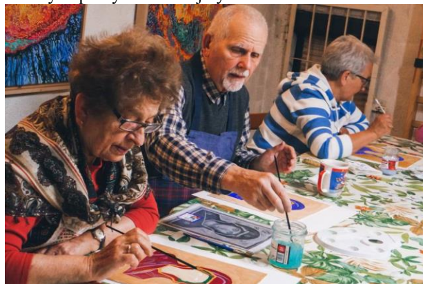
Warsztat ikonopisarstwa – 09.05.2024 r. – SK „Europa”

Inicjatyw Lokalnych WIL.DA.SIĘ zachęcaliśmy najbliższych mieszkańców i mieszkanki do organizacji własnych pomysłów i inicjatyw