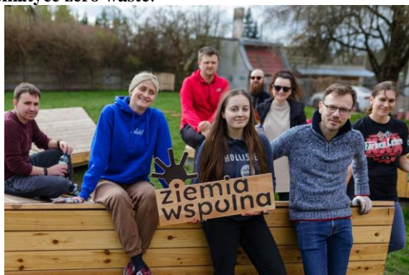
Pierwsi właściciele grządek na Ziemi Wspólnej – 16.03.2024 r.

W ogrodzie społecznym Ziemia Wspólna tętniło życie w szczególności wiosną i latem. Dzięki dotacji w konkursie Niebieskie Granty od Volkswagen Poznań mogliśmy tą przestrzeń rozbudować o nowe grządki dla mieszkańców i mieszkańek, budowę kompostownika i kosza do segregacji odpadów czy zrealizować warsztaty florystyczne, z budowy karmników dla ptaków oraz o tematyce zero waste.