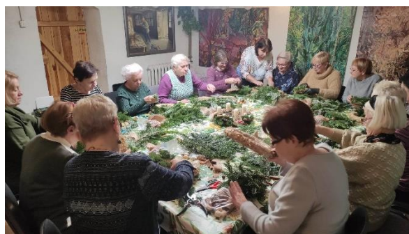
Podczas tworzenia wieńców adwentowych w ramach Wildeckiego Klubu Senioralnego Schron III Wieku