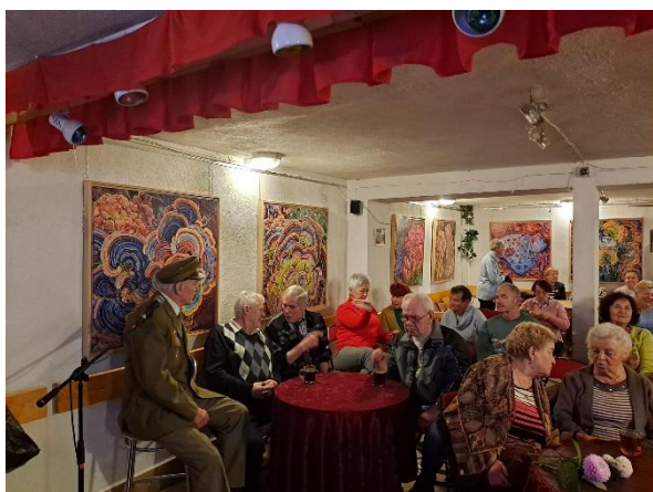
Wieczór patriotyczny z okazji 11 listopada

Przypominamy także, że nieustannie czekamy na osobiste państwa inicjatywy, które możemy wesprzeć miejskim groszem i doświadczeniem wolontariuszy. Cieszy szczególnie to, że „młode pokolenie” które debiutowało w 2005 roku w „kultowych” jasełkach w Schronie Kultury „Europa” powraca teraz w roli rodziców i przejmuje od starszych inicjatywę kontynuowania idei, która stała u zarania powstania SK „Europa”. Wszystkim, którzy w jakikolwiek pomagają zarówno w funkcjonowaniu Spółdzielni Mieszkaniowej „Rolna”, a więc: Pracownikom, Współpracownikom, Członkom i Członkiniom Rady Nadzorczej, Wolontariuszom, Prowadzącym