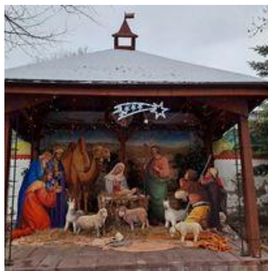
Tegoroczna Szopka Artystyczna J.Luczaka na Topolowym Fyrtlu zaprasza do odwiedzin