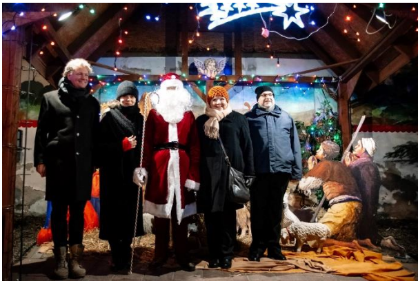
Kolędnicy 2021 na Topolowym Fyrtlu